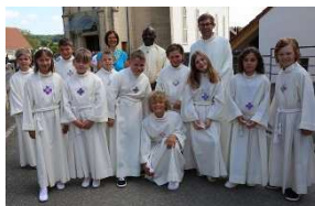
18.05 Galerie photos : Communion C'tedoux