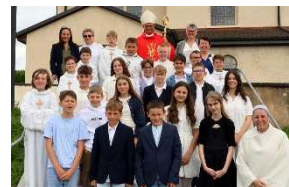
25.05 Galerie photos : Confirmation Alle