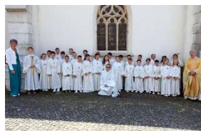
18.05 Galerie photos : Communion Porrentruy