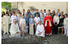
11.05 Galerie photos : Confirmation St-Ursanne

A retrouver sur notre site www.cath-ajoie.ch :